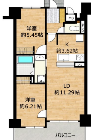
※現況と異なる場合があります